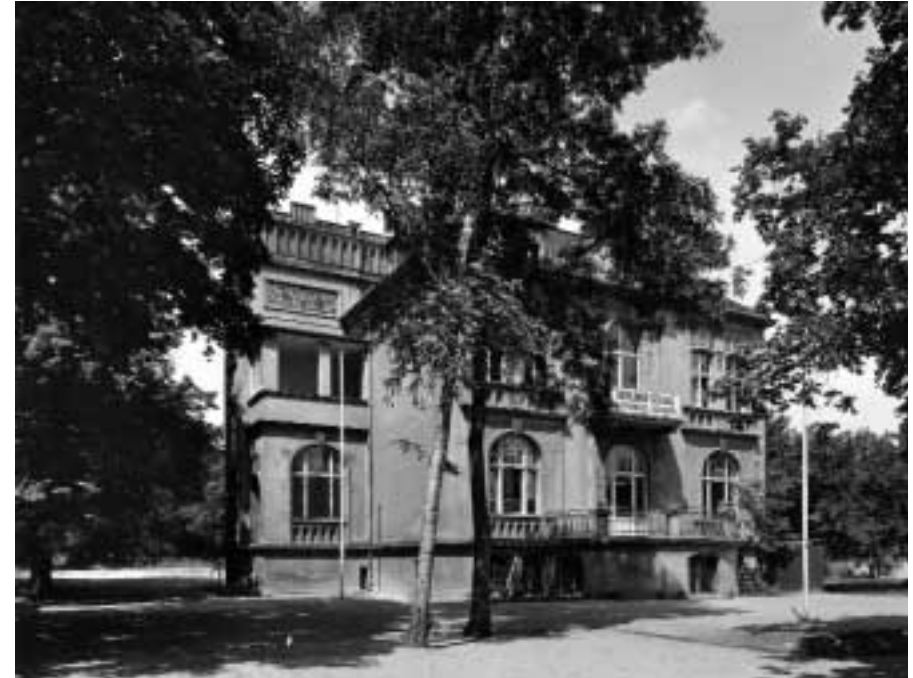
Schwartzsche Villa, aufgenommen im Jahr 1956 (Straßenansicht)

Alternanthera , lateinisch-griechisch für Wechselkölbchen, ist ursprünglich in Mittel- und im tropischen Südamerika beheimatet und hierzulande unter dem Namen Papageienblatt bekannt. Wegen seiner dekorativen rot und grün gestreiften Blätter wird das Papageienblatt gerne als Einfassungspflanze für Beete verwendet. Bei Alternanthera amoena handelt es sich um eine Zuchtvariante, über die drei anderen Unterformen schweigen sich die gängigen Pflanzenhandbücher aus. Mesembryanthemum gehört zu den Mittagsblumengewächsen, die als sukkulente Pflanzen mit auffälligen margeritenartigen Blüten leuchtende Farbteppiche bilden, wenn sie in größeren Mengen auftreten. Dracaena indivisa ist ein Drachenbaum, Taxus