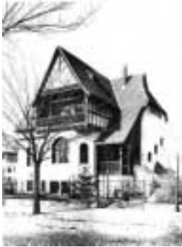
Links Villa Pichler von 1893 in der Bahnstraße 11.