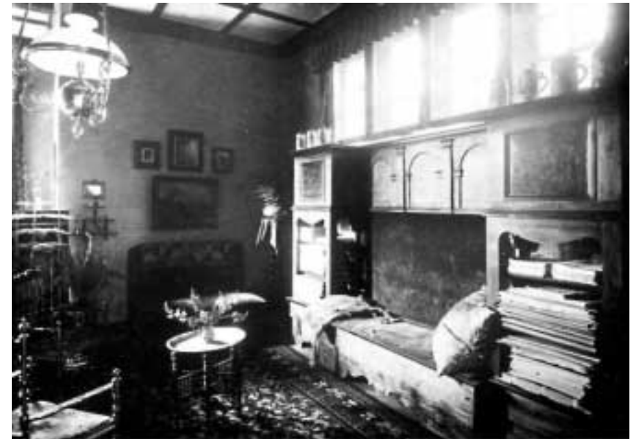
Das Herrenzimmer im Hause Buhrowstraße 12

verborgen - einen halben Meter unter Gartenniveau. Unter dem Familienwappen der Güstrower Linie der Spaldings treten die Bewohner und Gäste nach dem heraldischen Willkommensgruß in den Windfang ein. In der zweigeschossigen Diele wärmt der offene Kamin und offenbart ein Jugendstilrelief den Geist seiner Bewohner. In der Mitte des offenen Treppenhauses stand ein Esstisch, an dem sich womöglich der Gärtner stärkte. Tritt man durch das mit Stuckaturen verzierte Bogenfeld, so zieht das Licht der vier runden Halbkugeln an der Decke die Blicke nach oben. Sowohl bei Nacht als auch bei einfallendem Tageslicht ergab sich eine dramatische Raumszenierung. Nach der Drehung auf dem Treppenabsatz steht man, oben angekommen, auf der Galerie, über welche man das Herrenzimmer betritt. Es befindet sich über dem Eingang mit vier schmalen Fenstern zur Straße und verfügt über einen schmalen Balkon nach Norden. Werfen wir einen diskreten Blick in den Rückzugsort des Hausherrn, so scheint der Raum von einem würzigen Tabakduft erfüllt und in den Ablagen der Bank aus längst vergangenen Tagen ruhen die wohl sortierten Architekturzeitschriften und Kunstblätter.