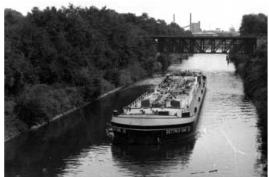
Öltanker vor dem Hafen Lankwitz, im Hintergrund die Brücke der Dresdener Eisenbahn und S-Bahnlinie 2, Foto um 1975