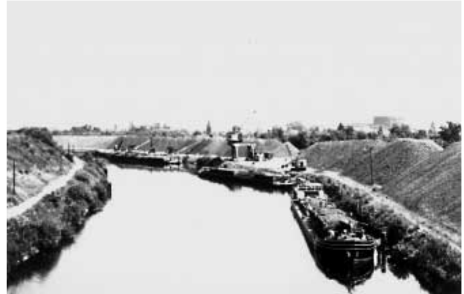
Baustoffumschlag im Hafen Lankwitz, im Hintergrund das Gaswerk Mariendorf, Foto am 1. Juli 1953