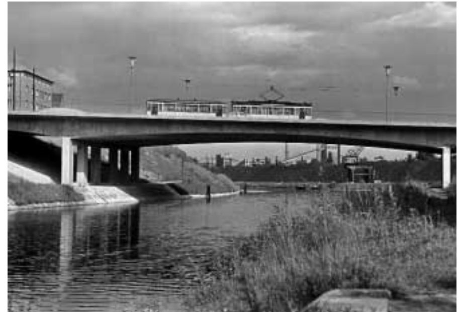
Die Sieversbrücke in Lankwitz

Die Rückkehrer und Flüchtlinge mussten den Teltowkanal mühevoll mit Karren und Kinderwagen über Notstege überqueren. Nicht selten lauerte am anderen Ufer Gefahr, wie Lankwitzer Frauen berichten. Die Brücken wurden dann von amerikanischen Pionieren provisorisch hergerichtet, denn die US-Truppen mussten von ihrem Hauptquartier in die abgeschnittenen Bezirke ihres Sektors gelangen. Die 332. Engineers zogen im August in die Lankwitzer Oliver Barracks ein und bauten die Notbrücken. Am 15.7.1945 war die Kirchnerbrücke (Nicolaistraße) und am 25.5.1946 die Sieversbrücke (Kaiser-Wilhelm-Straße) fertig gestellt. Die wichtigste Brücke war in dieser Zeit die Kirchnerbrücke, die aber später im Gegensatz zu den anderen Brücken nicht wieder neu errichtet wurde, die Nicolaistraße endet heute am Kanal. Auch die Karl-Lange-Brücke wurde nicht wieder als Straßenbrücke aufgebaut; über den heutigen Edenkobener Steg sind nur Fußgänger und Radfahrer zugelassen. Die sowjetischen Soldaten bauten noch nach dem Juli 1945 an der Eisenbahnbrücke der Dresdner Bahn (heute S-Bahnlinie 2 nach Blankenfelde). Wenn sie im Fichtelgebirgsviertel nördlich von Alt-Lankwitz plündern kamen, rasselten die