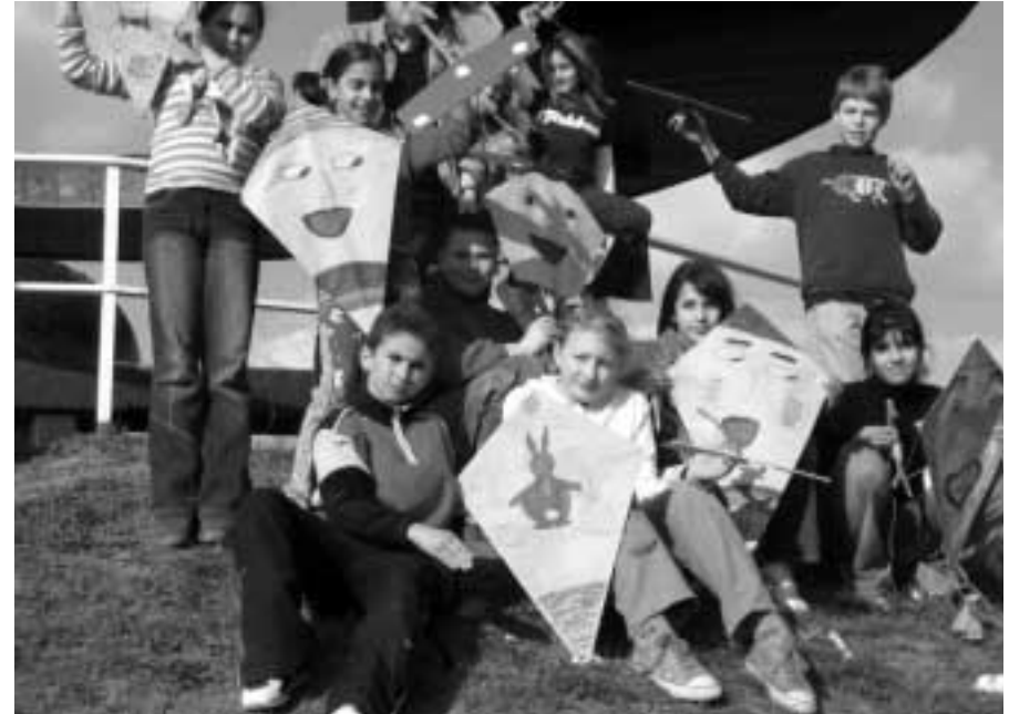
Kinder des Fliege-Projektes lassen ihre selbstgebastelten Drachen auf dem Fliegeberg steigen. Ein Mitarbeiter des Steglitz-Museums erklärt ihnen dabei, warum Otto Lilienthal diesen Berg hat aufschütten lassen.