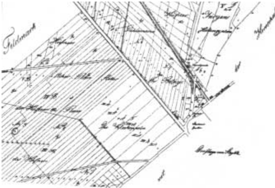
"Die Kleekoppeln" auf dem Eckgrundstück 1839. Die Schloßstraße führt nach links oben, da auf dieser Karte "Norden" links ist. Der Weg, der von der Grunewaldstraße abzweigt, wurde später überbaut.

1838, die Eisenbahn fuhr bereits durch Steglitz, blicken wir auf den „Plan von Steglitz mit dem Reflektor aufgenommen“. Hier sind erstmals gegenüber dem Chausseehaus vier Gebäude zu erkennen. Bauunterlagen aus jener Zeit sind leider nicht erhalten oder wurden nie angefertigt. Aber in der „Karte von dem Acker und der Hütung der Gemeinde Steglitz“ von 1839, die nur die landwirtschaftliche Nutzung, aber keine Gebäude zeigt, ist zu erkennen, dass das Gelände in sieben Parzellen unterteilt ist. Deutlich steht auch der Hinweis „Die Kleekoppeln“ da, was ein Hinweis auf Weideland sein kann, das hinter den Gebäuden lag.