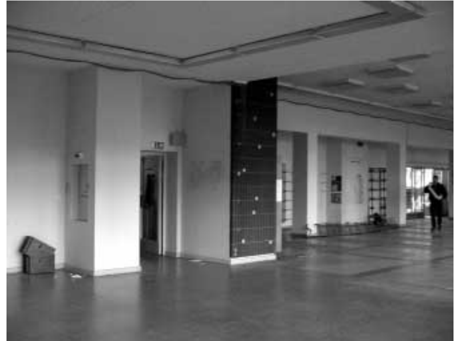
Der leer geräumte Lesesaal der Stadtbücherei am 9.12.2003.

Auf dem Grundstücksteil vor der Gunkel-Schule entstand 1920 direkt an der Straße eine Büro-Baracke der Steglitzer Verwaltung, um bisher genutzte Räume in der Berlinickestraße 15 wieder für Wohnzwecke zur Verfügung stellen zu können. Der Behelfsbau wurde 1936 wieder abgerissen. An fast gleicher Stelle erhielt die Bücherei 1957/58 vorn an der Grunewaldstraße einen zweigeschossigen Neubau. Er nahm auch das Grundstück Nr. 3 mit ein, auf dem ein im Krieg zerstörtes großes Mietshaus aus dem Jahre 1889 stand. In den Altbauten auf dem Hof waren später Teile des Bezirksamtes untergebracht, hauptsächlich die Abteilung Jugend und Sport. Der geplante Umzug in den neuen Kreisel ließ sich wegen der Bauplätze