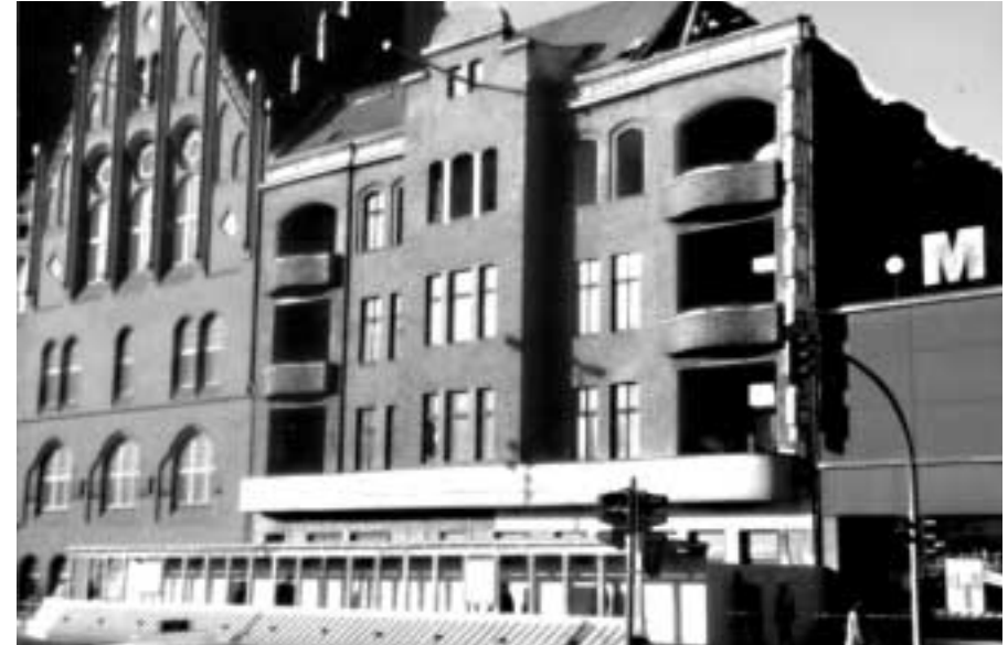
Oben das alte Haus Schloßstraße 36 (Bj. 1897) am 27.11.1980 kurz vor dem Abriss, unten der Neubau (Bj. 1982) am 22.8.2003 kurz vor dem Abriss. Jeweils links das Rathaus, rechts die Möbelgeschäfte.

Übrigens: Den Rekord in der kürzesten Lebensdauer eines Gebäudes in Steglitz dürfte das Haus Menckenstraße 28 halten, das 1954 errichtet wurde. Es stand der Auffahrt zur Joachim-Tiburtuis-Brücke im Wege und wurde ca. 1964/65 wieder beseitigt.