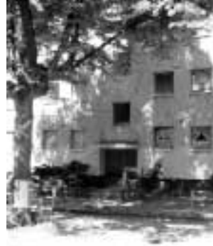
Rechts der Neubau von 1972 an gleicher Stelle. Ob der Baum auf dem Foto links der selbe ist wie auf dem Foto rechts?