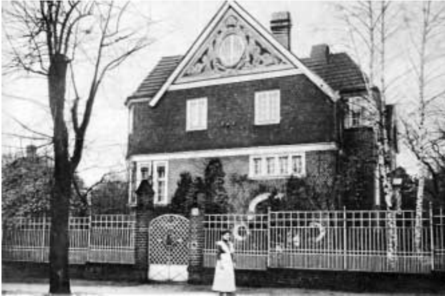
Villa Spalding in der Buhrowstraße 12 von 1901

dessen Schmalseite zur Bahnstraße zeigt, an die Grenze zum Nachbargrundstück. Somit liegt der Garten vor den Wohnzimmern zur Dahlemer Straße und trägt Sorge für ein größtmögliches Maß an Intimität. Die schmale hohe Eingangsfassade gestalten Spalding und Grenander in horizontalen, um die Fassadenecken geführten Bändern aus weißgefugtem Mauerwerk im Erdgeschoss, Hängeziegeln im Obergeschoss und einem abschließenden Giebelfeld. Das Prinzip der horizontalen Schichtung verweist auf die Londoner Siedlung Bedford Park aus den 1880er Jahren von Richard Norman Shaw.