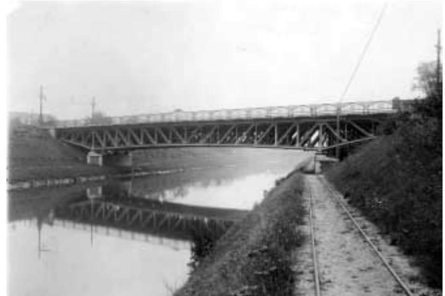
Der Teltowkanal. Ufer mit Treidelbahnschienen an der Siemensbrücke

Es bot sich natürlich auch an, diesen Kanal auch wirtschaftlich, zur Erschließung für die boomende Industrie und die Schifffahrt zu nutzen. So war die Vorläuferorganisation der Teltowkanal AG auch eine Terraingesellschaft zur Industrieansiedlung, die ihr Geschäft mit großem wirtschaftlichen Erfolg betrieben hat. Eine Besonderheit des Teltowkanals, der im Eigentum des Landkreises Teltow verblieb und von ihm auch betrieben wurde, war die erstmalige Verwendung des elektrischen Treidelbetriebes in Deutschland, wofür übrigens acht weitere Brücken erforderlich wurden. Einige dieser Brücken sind Gegenstand der aktuellen Ausstellung des Heimatvereins Steglitz. Der Treidelbetrieb, für den der Kanalverwaltung ein