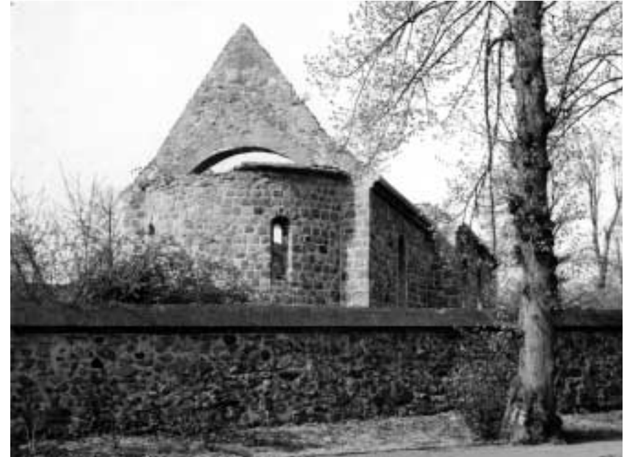
Dorfkirchenruine kurz vor dem Wiederaufbau 1952