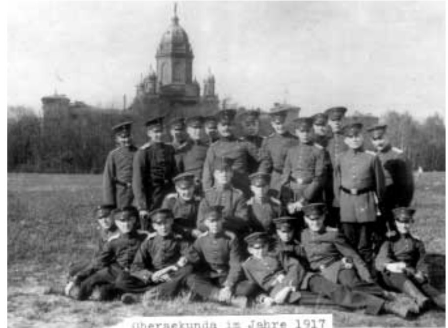
Übersekunda im Jahre 1917 Stubengemeinschaft, im Hintergrund mit der Hauptkadettenanstalt