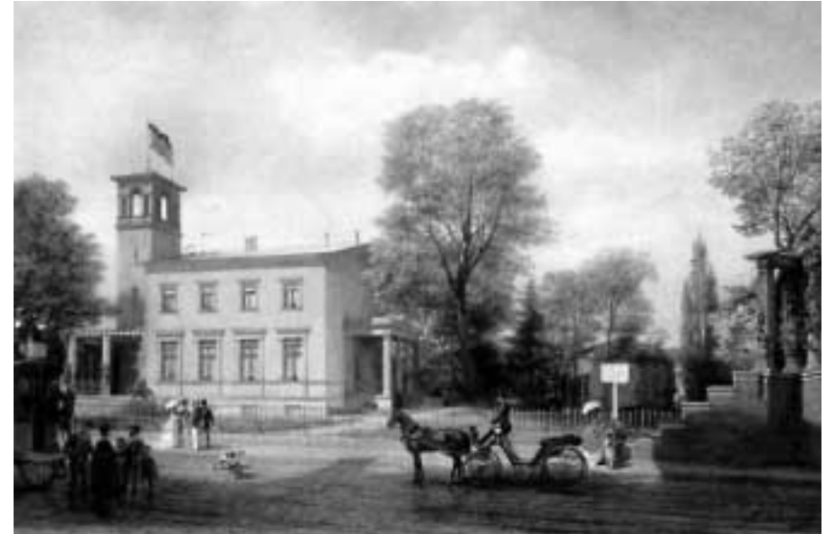
Die „Villa Lydia“ in Steglitz, Gemälde von Albert Schwendy, 1872, in Privatbesitz