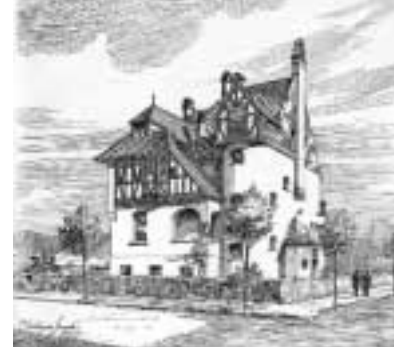
Links Villa Spalding & Grenander von 1893, Brandenburgische Straße 16 / Liebenowzeile , rechts der Neubau an gleicher Stelle von 1962.