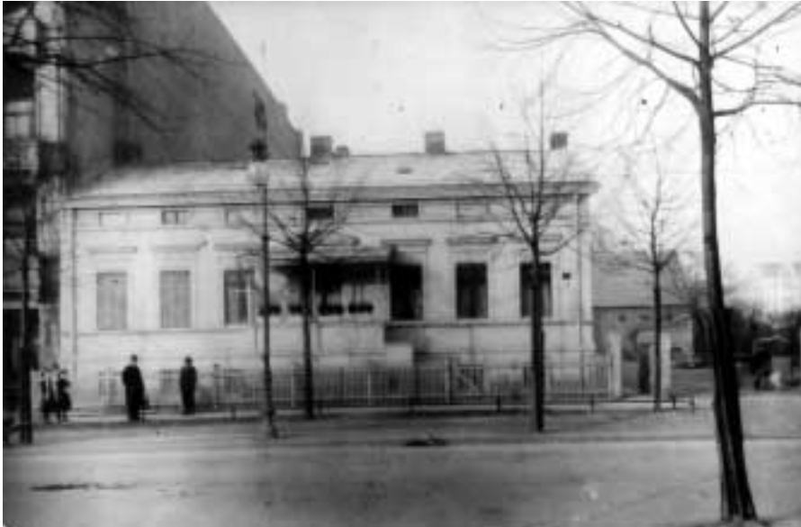
Wohnhaus Schloßstraße 34-35 (Bj. ca.1880) um 1900