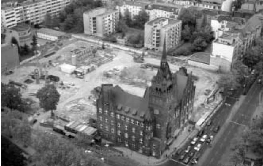
oben: das leer geräumte Grundstück am 21.5.2004. unten: das Center wächst in die Höhe (1.6.2005), der "Wohnpark Schloßstraße", Schloßstraße 33, ist noch nicht abgerissen.