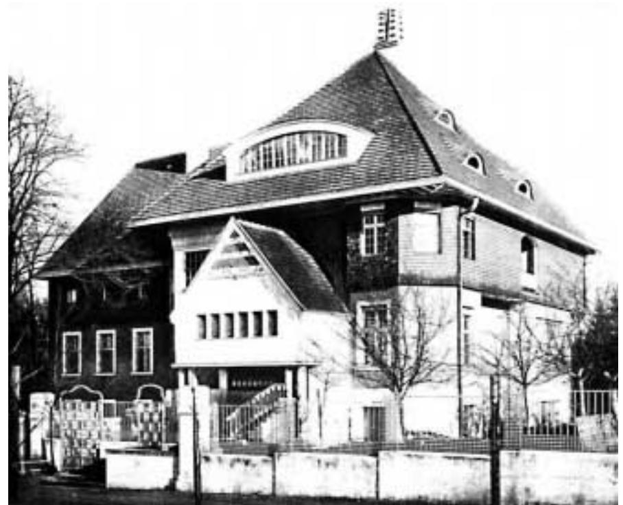
Landhaus Berliner Straße 1 von 1904