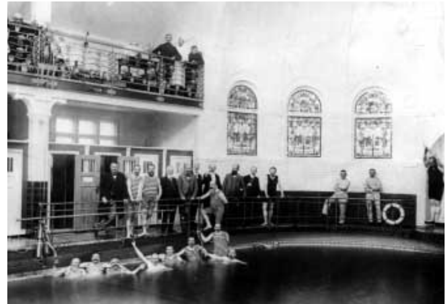
Das Stadtbad kurz nach seiner Eröffnung

Für einen Euro wechselte das Haus seinen Eigentümer, allerdings mit der Auflage, wieder ein Schwimmbad in den denkmalgeschützten Räumen zu betreiben. Damit sind sämtliche Schwierigkeit in einem Satz zusammengefasst, und das Vorhaben kostet Geld: 5,5 Millionen Euro wurden geschätzt.