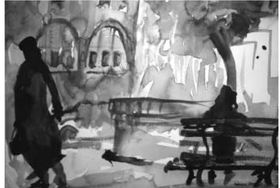
Auf dem Hermann-Ehlers-Platz, Aquarell von Margot Nesso, 1988

Der Luxus ist z.T. verschwunden. Viele Qualitätsgeschäfte sind umgezogen. Vielleicht zum Alexanderplatz? Einige Feinschmecker-Restaurants sind abgewandert. Elegante Cafes gibt es nicht mehr. Neben wichtigen Fachgeschäften eröffneten bekannte Fast Food-Restaurants, Billigläden und Ramschgeschäfte, z.T. für nur einige Wochen gemietet. Imbissbuden haben viel zu tun. Würstchengeschmack fast an jeder Straßenecke. Unsere großen Kaufhäuser halten wenig Personal. Die "Gucker" sind vorhanden, Käufer weniger. Große Werbeschilder und Plakate "schmücken" die Schloßstraße ungemein. Hausfrauen, Arbeitslose, Jugendliche, arme junge Ausländer laufen an den Auslagen achtlos vorbei. Das Geld reicht oft nur für