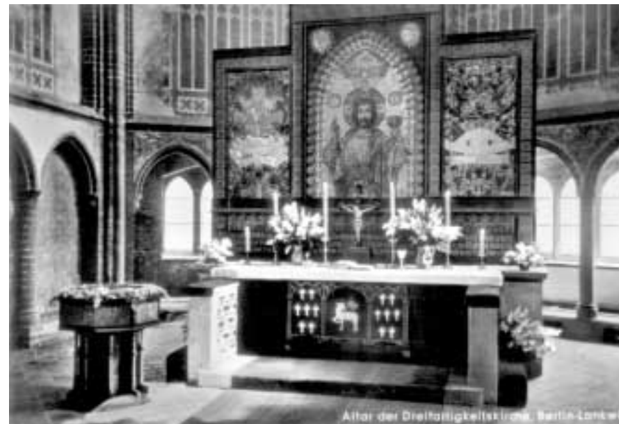
Der Hochaltar wurde in den 50er Jahren abgebaut