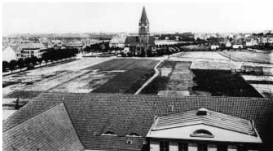
Blick vom Turm des Lyzeums (Beethovensschule) um 1920

In der Nacht zum 24. August 1943 wurde Lankwitz durch einen Bombenangriff zu 85 % zerstört, auch die Dreifaltigkeitskirche und die Gemeindehäuser wurden schwer beschädigt. Die Turmspitze stürzte brennend herab, der steinerne Turm blieb und wurde zum Symbol für eine kommende friedfertige Zeit. In der Bomben-