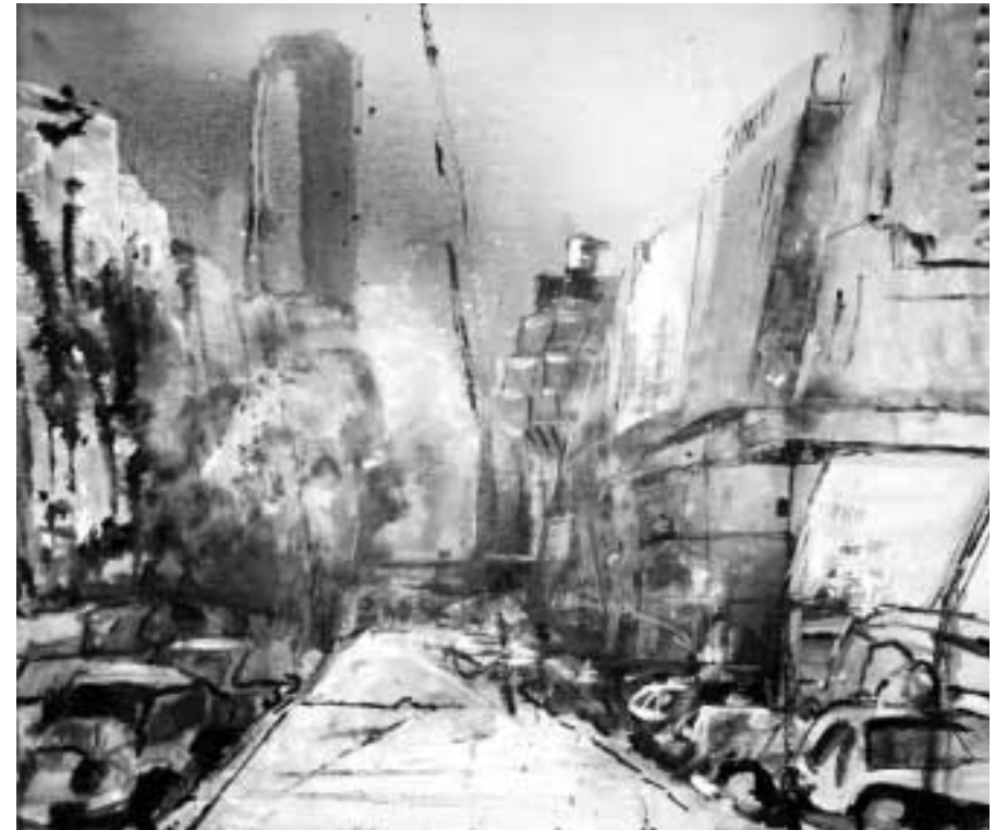
Die Schloßstraße, Gemälde von Margot Nesso, 1988

Die glückliche Welle fiel tief hinab. Der 2. Weltkrieg begann! Die Fenster mußten verdunkelt werden. Sirenen heulten. Menschen flohen in die Luftschutzkeller vor dem feindlichen Bombenfall. Nachts, manchmal auch am Tage, ließen die Flieger dröhnend ihre Explosionen fallen. Brandbomben krachten. Flammen schlugen hoch. Fensterlöcher blieben übrig. Angst und Bangen herrschte. Nach dem Schulunterricht klebte ich als Mithilfe im Feinkostgeschäft Nöthling in der Schloßstraße eingenommene Lebensmittelmarken auf Zeitungspapier. Belohnung: Schokolade, eine erfreuliche Abwechslung in dieser Zeit.