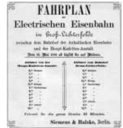
Nachdruck des Fahrplanes zum Gedenken an die erste Elektrische Eisenbahn in der Morgensternstraße an S-Bahnhof Lichterfelde Ost

Um die Benutzerfreundlichkeit der Bahn zu verbessern, wurde Anfang 1893 die ältere Teilstrecke in schon teilweise bebaute Straßen verlegt. Von der Zehlendorfer