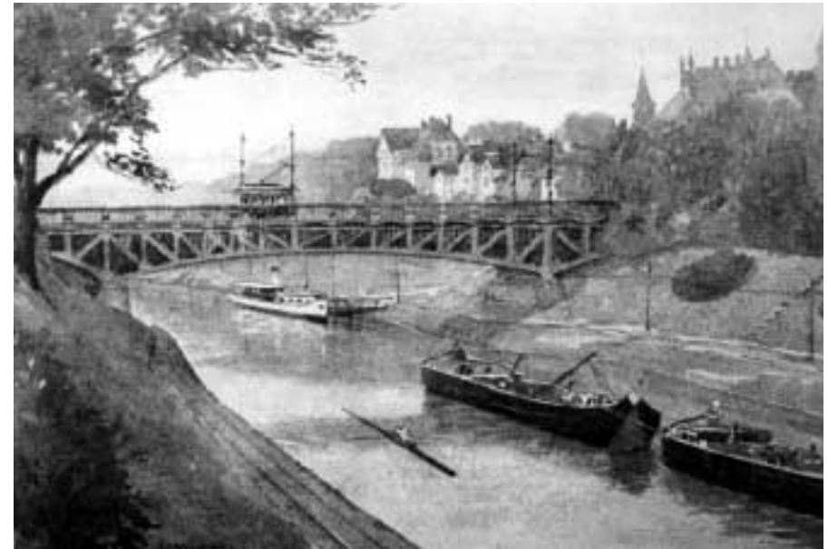
Der Teltowkanal an der Giesensdorfer Brücke

Die Zahl der Sportboote zeigt nur eine geringe Veränderung, während die Anzahl der Fahrgastschiffe und Güterschiffe besonders in den letzten beiden Jahren an- stieg. Die geschleuste Gütermenge entspricht für das Jahr 2005 etwa 900.000 t. Die Grenze der Leistungsfähigkeit für den Teltowkanal und seine Schleusen ist si- cher noch nicht erreicht.