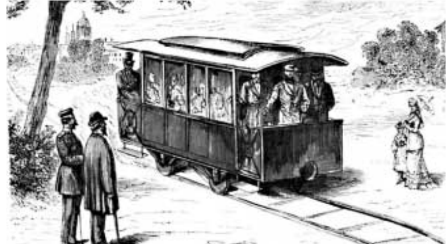
Die erste „Elektrische“ auf dem Weg von der Kadettenanstalt zum Bahnhof Lichterfelde Ost