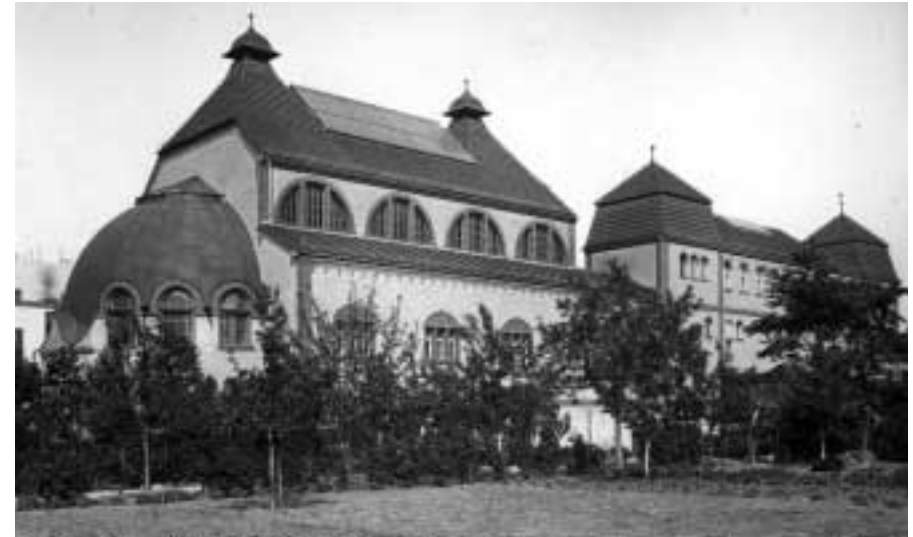
Das Stadtbad 1920