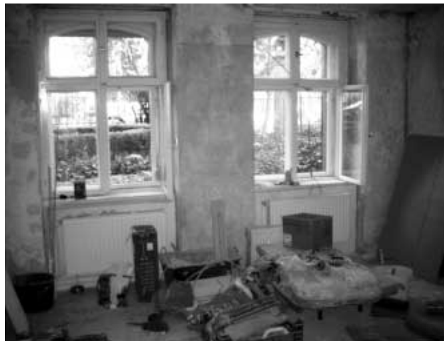
Bauarbeiten im Souterrain