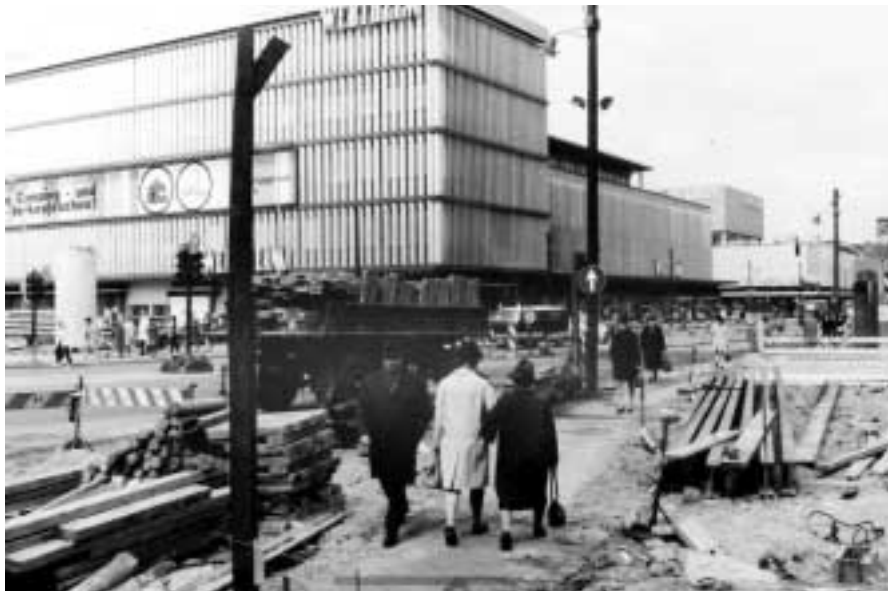
Baustelle an der Schloßstraße in den 50er Jahren