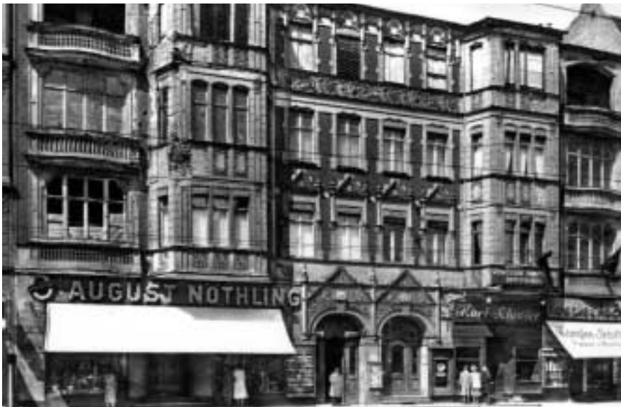
Stadtküche Nöthling, Schloßstraße 28, 1948

Eine fröhliche hohe Welle gab es in meiner Kindheit. Ich kam in der Feuerbachstraße, die auf die Schloßstraße führt, zur Welt. Damals war die Straße wie in einem Vorort. Es brumnten keine Busse, nur selten fuhr ein Auto. So konnten wir Kinder auf dem Damm toben, Treibeball spielen und auf dem Fußgängerweg Hopse hüpfen. Heute fahren die Hochbusse alle fünf Minuten. Der Autoverkehr reißt tagsüber nicht ab.