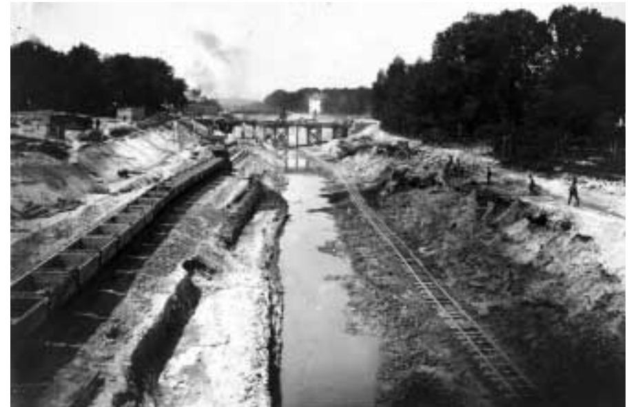
Der Teltowkanal im Bau

Arbeitskreis Historisches Lankwitz "Chronik Lankwitz", Berlin 1989 Karl Helmstädt "Lankwitz. Geschichtliches in Wort und Bild aus Vergangenheit und Gegenwart", Lankwitz 1911. Berichte Lankwitzer Bürger Gemeindezeitung „Lankwitz Kirche“