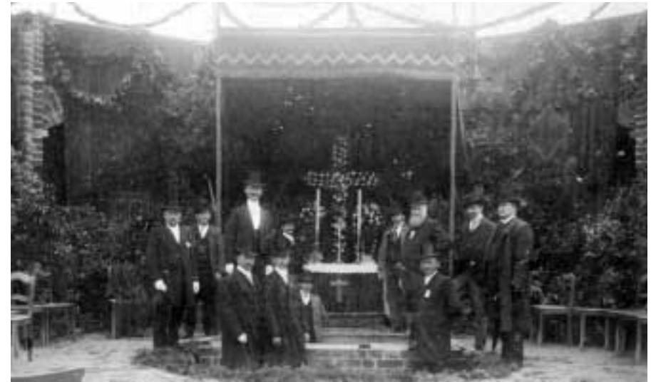
Grundsteinlegung der Dreifaltigkeitskirche

Errichtet wurde die Dreifaltigkeitskirche nach den Entwürfen des Geheimen Regierungsbaurates Ludwig von Tiedemann in den Jahren 1903 bis 1906. Am 26. Juni