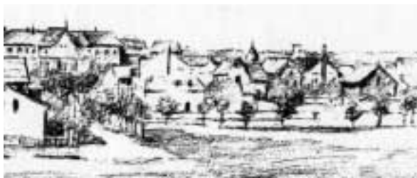
hinten das Gymnasium, vorn das Ende der Südendstraße, rechts das Gelände der Heese'schen Plantage

1893/94 erbaute Otto Techow für den "Bruderbund am Fichtenberg" das Logenhaus, Albrechtstraße 112. Heute ist das Gebäude durch Anbauten stark verändert.