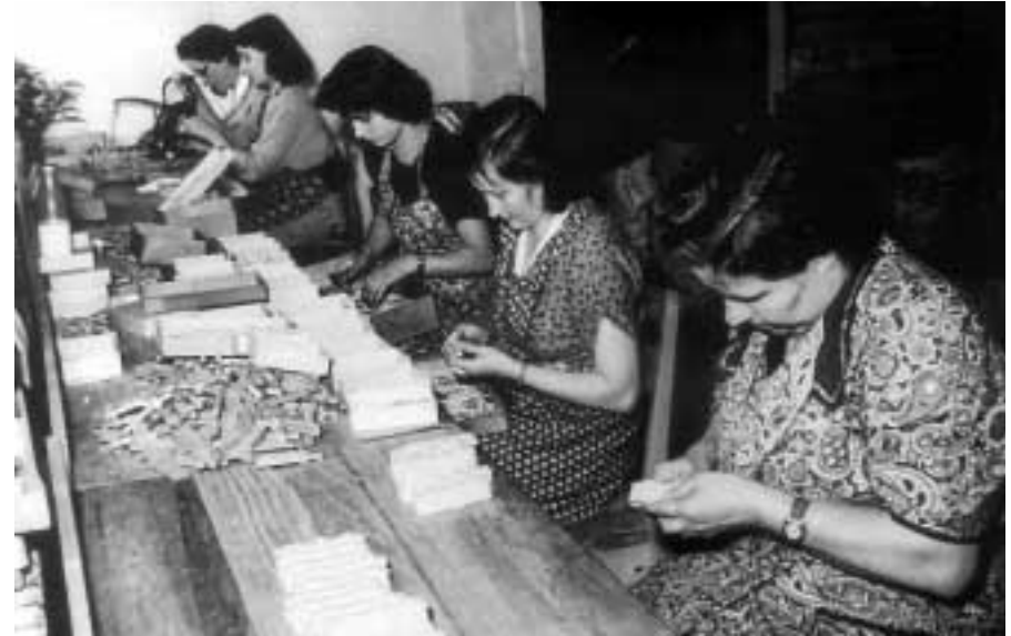
Frauen bei der Montage der Wiking-Modelle