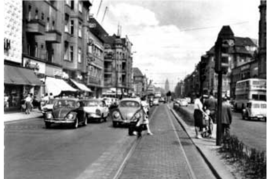
Schloßstraße bei Woolwoorth, 1965

Und wieder fiel die Welle tief hinab. Die Mauer mit Wachttürmen wurde rings um West-Berlin gezogen. Wir waren nun amerikanischer, englischer und französischer Sektor. Am Anfang der Blockade brauchten wir etwa acht Stunden, um mit unseren Kindern im Auto durch den Ostsektor zu den Großeltern zu fahren. Die Kontrolle an der Grenze war scharf und bedenklich langsam. Erst später wurde das Passieren am Übergang menschlicher.