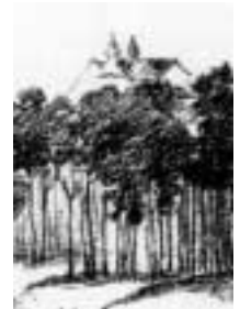
Plathsches Haus, Albrechtstraße 105, 1. hohes Haus in der Albrechtstraße