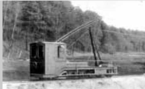
Treidellokomotive am Teltowkanal

Um Ufer und Kanalsohle vor Zerstörung durch Schiffsschrauben und Wellengang der schleppenden Schiffe zu bewahren, wurde an beiden Ufern des Teltowkanals ein elektrisches Treidelsystem je Fahrtrichtung vorgesehen. Dabei wurden spezielle Lokomotiven mit 7500 kg Gewicht von Siemens-Schuckert auf 1,0 m Spurweite verwendet. Sie besaßen vorn ein Drehgestell mit zwei 8 PS-Elektromotoren (800 Umdrehungen pro Minute, Gleichstrom, Spannung 500 bis 600 Volt). Die Stromversorgung erfolgte über eine Oberleitung. Eine Lokomotive konnte zwei Normalkähne mit zusammen 1200 t Nutzlast bei 4 km/h Geschwindigkeit und einer Zugkraft von rund 1000 kg durch den Kanal befördern. Eine anschauliche, historische "Treidelszene" findet sich in Lichterfelde an der Emil-Schulz-Brücke gegenüber dem Postamt Hindenburgdamm.