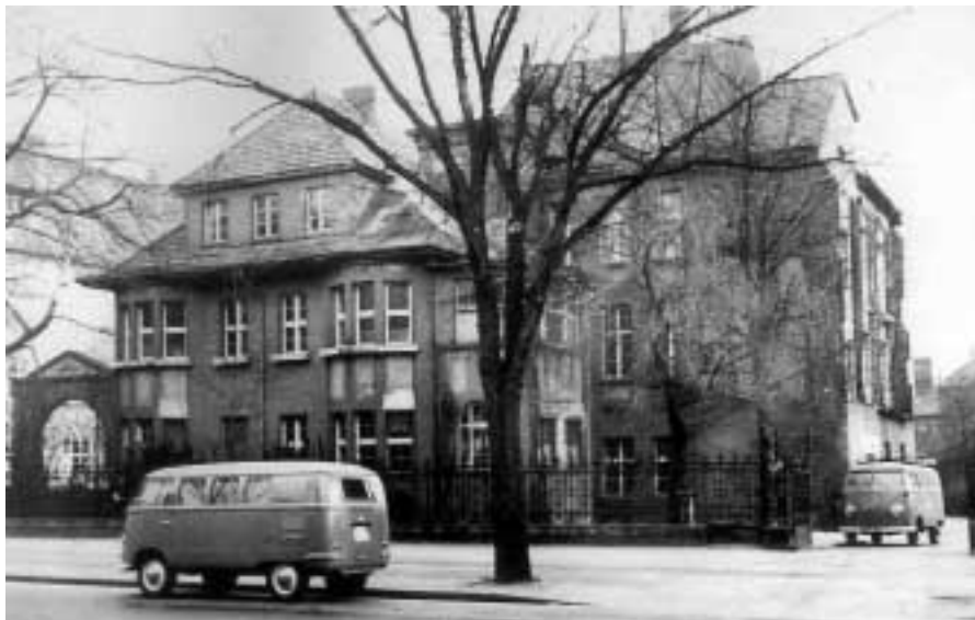
Die „Wiking-Villa“ Unter den Eichen, heute befindet sich hier ein Lebensmittel-Supermarkt

Jetzt wird's offiziell: Am 1. Oktober 1936 lässt der Modellbau-Enthusiast die Firma "Wiking Modellbau Peltzer & Peltzer" beim Berliner Amtsgericht als Offene Handelsgesellschaft ins Handelsregister eintragen. Längst kommt die Fertigung mit dem Platz in der Dahlemer Straße 77 nicht mehr aus - der Umzug in die einstige Brauerei-Dependance von Prinz Max zu Fürstenberg "Unter den Eichen 101" erweist sich als Glückstreffer. Als neuer Mieter gelingt es nach und nach, die Räume für die modellbauerische Tätigkeit vorzubereiten. Büros, Werkzeugbau, Maschinen- und Druckerei, Montage - alles lässt sich in dem Objekt unterbringen. Der Brauereibesitzer aus Donaueschingen hatte seinem Industriebetrieb eine noble Villen-Optik spendiert, die auch Jahrzehnte später noch ungeheure Strahlkraft besitzen soll.