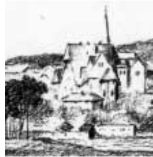
sogenannte Zippelvilla, Humboldtstraße Kirchturm der Matthäuskirche